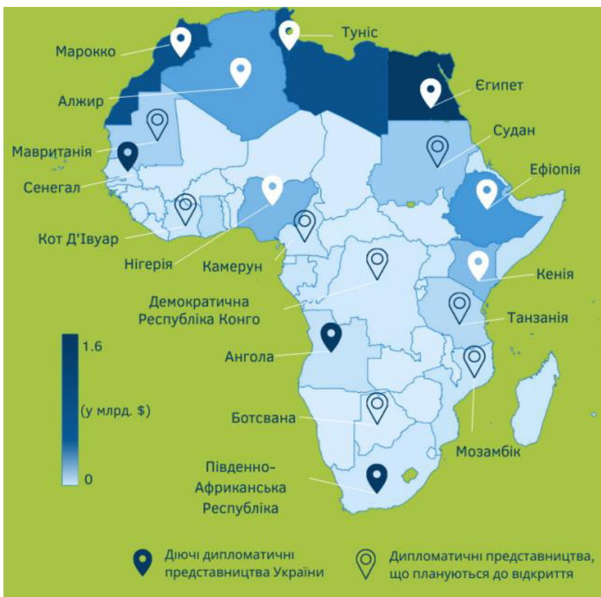
Рис. 1 Обсяг імпорту продовольства з України у 2021 році.

Слід відзначити, що наведена вище статистика відноситься до торгово-економічного співробітництва України з країнами Африки до початку повномасштабного військового вторгнення Росії. Цей військовий конфлікт мав серйозний негативний вплив на цю співпрацю, порушуючи стабільність та безпеку в регіоні і поставивши серйозні виклики перед економічними зв'язками між Україною та країнами Африки[20].