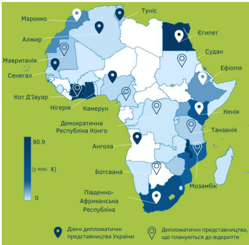
Рис. 2 Експорт продуктів харчування до України у 2021 році.

Відновлення масштабів і темпів подальшого розвитку співпраці буде можливим лише після завершення російсько-української війни. Повернення до нормального режиму співробітництва та відновлення довіри між Україною і країнами Африки буде важливим кроком на шляху до відновлення економічних, торговельних і культурних зв'язків між сторонами.