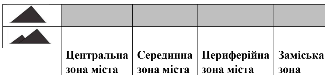
Особливості розміщення териконів та їх груп у структурі міст Донбасу

Висновки. Отже, аналіз сучасної планувальної структури містобудівних утворень Донбасу дозволив виявити особливості формування відкритих міських просторів й порушеному середовищі. Перш за все слід зазначити, що розташування порушених територій нерозривно пов'язане з історичним розвитком населених пунктів на території даного регіону, природними умовами та закономірностями формування вугледобувної промисловості. Проте кожна з зон міста, як виявило дослідження, теж має свої особливості формування відкритих міських просторів.